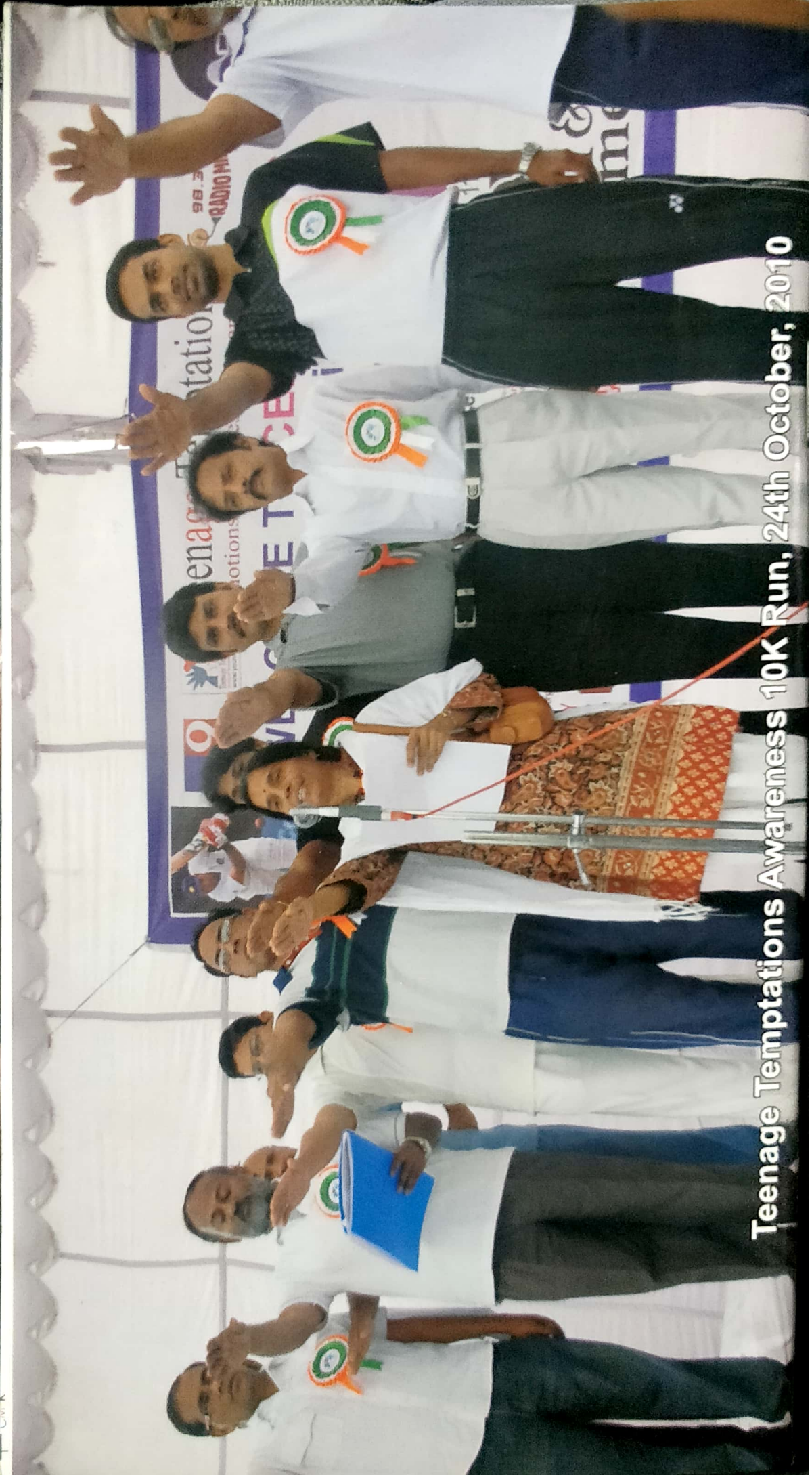
Teenage Temptations Awareness 10K Run, 24th October, 2010